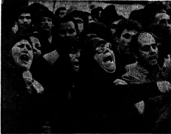
خیابان آیتاله خلخالسی (تخت جمشید سابق) گسارت آمریکا در آن قرار دارد این روزها شاهد تظاهرات ملی و ضد امپریالیستی گروه های مختلف مردم تهران است. در این عکس گروهی از خانواده های تهرانی، با شعار های کوبنده روش ها، انگلیزانه و استعماری آمریکا را محکوم میکنند. آمیز مربوط به وضع سفارت آمریکا در منطقه/پنجاه و نه