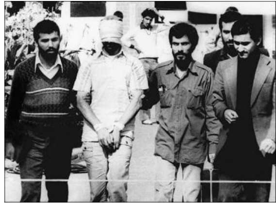
گروگان گیری یکی از کارکنان سفارت آمریکا (با چشم بند) توسط دو ایرانی در جریان تصرف سفارت آمریکا.

تظاهرات ضد امپریالیستی در مقابل سفارت آمریکا، ۲۱ آبان ۱۳۵۸