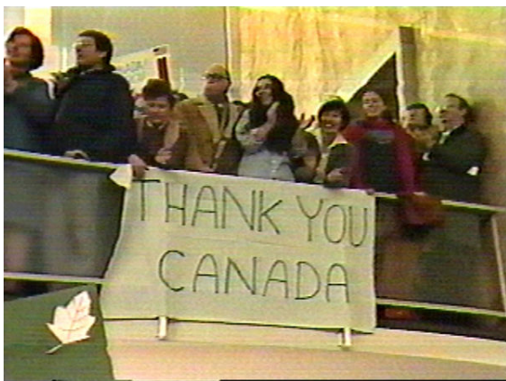
تشکر امریکاییان از کانادا بخاطر کمک به فرار شش تن از گروگانها