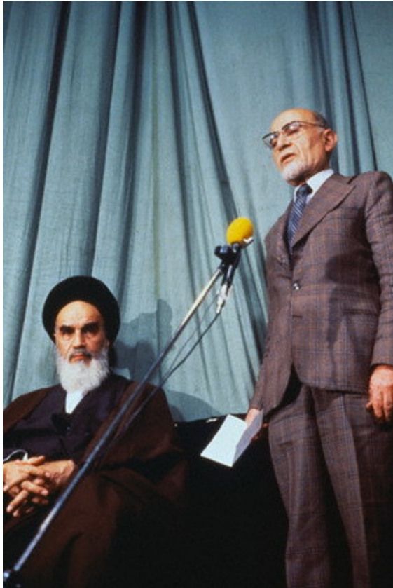
سخنرانی بازرگان پس از دریافت حکم نخست‌وزیری

دولت موقت ایران در سال ۱۳۵۷ که با نام دولت موقت انقلاب هم شناخته می‌شود، دولتی در ایران بود که پس از انقلاب از سال ۱۳۵۷ و به منظور رسیدگی به اوضاع به فرمان سید روح‌الله خمینی تشکیل شد و تا ۱۳۵۸، پیش از اعلام استعفای مهدی بازرگان به مدت ۹ ماه (به طور دقیق ۲۷۵ روز) بر سر کار بود.