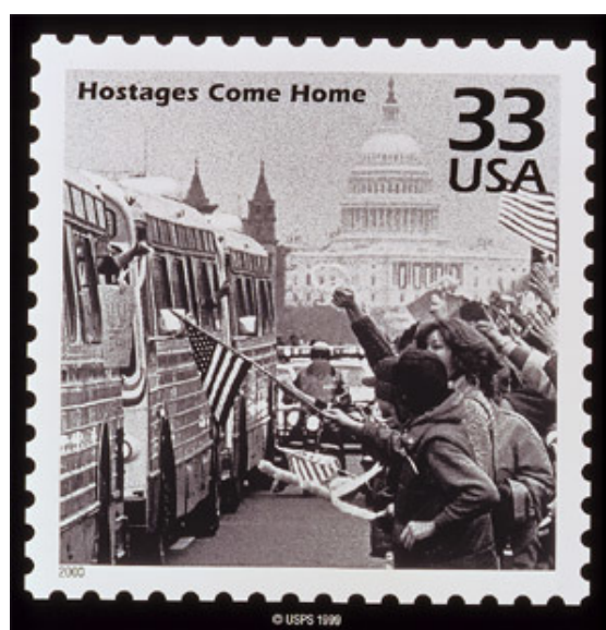
تمبر یادمان کشور آمریکا به مناسبت بازگشت گروگان‌های آمریکا از تهران