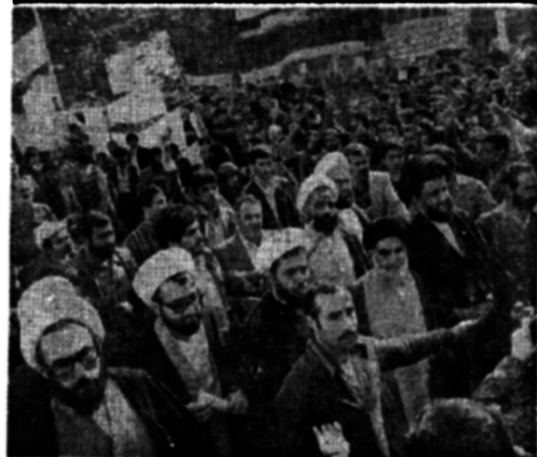
بعد از ظهر دیروز نمایندگان جامعه روحانیت مبارز برای اعلام هیستکی و پشتیبانی از صل انگلی دانشجویان مسلمان بیرون خط امام از محل لانه جاسوسی امریکا بازید بعمل آوردند

دانشجویان مسلمان بیرون خط امام دیروز با سخنرانی به اقامت آیتالله موسوی خوئی او تین روز روز سیاسی خود را به پایان رساندند. در همان هنگام عده بسیاری از مردم که در طول یک هفته گذشته روز ها و شب های خود را در بیرون سفارت گذرانده همراه با دانشجویان بر آسفالت سرد خیابان آیتالله طالقانی نماز برپا داشتند دانشجویان پس از برپا داشتن نماز به یک جنبی سفارت دست زدند بازدید داشتن عکس امام خمینی و دادن شعر هایی مبتنی بر عز و راسخ آسمان به مبارزه با آمریکا در محوطه سفارت به راه می افتادند انفجاری دیروز را صف فشان فروش پزیر بهرزی مهده گریه بود و در جلوی دهکده ای که به همین مناسبت برپا شده بود صف طویلی از روزه داران بسته شده بود مشت های گره گرده مغارن ساعت بعد از ظهر دیروز بهرزی چندین بار برجم آمریکا در مقابل سفارت این کشور توسط گروه های پنجاه در صفات او ۱۰