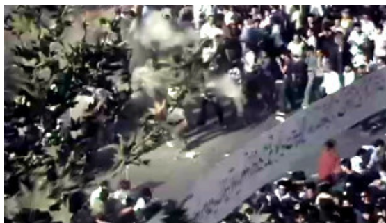
صحنه‌ای از رویدادهای ۳۰ خرداد ۱۳۶۰

پس از درگذشت آیت‌الله روح‌الله خمینی رهبر انقلاب ۱۳۵۷، مجلس خبرگان رهبری در ۱۴ خرداد ۱۳۶۸ و پیش از تدفین وی در جلسه‌ای فوق‌العاده آیت‌الله سید علی خامنه‌ای را به عنوان رهبر جمهوری اسلامی ایران انتخاب کرد. وی سرانجام با کسب بیش از ۷۲ درصد کل اعضا [14] به این مقام رسید. پیش از برگزیدگی و رأی‌گیری وصیت‌نامه سید روح‌الله خمینی خوانده شد. بنابر روایت آیت‌الله محی‌الدین حائری شیرازی نخست قرار بود رهبری شورایی شود ولی این موضوع مورد اجماع واقع نشد و نهایتاً رهبری به صورت فردی به اجماع اعضا رسید. [15][16][17][18][19][20][21][22][23] مجلس خبرگان رهبری بر اساس اصل ۱۰۷ قانون اساسی وظیفه تعیین رهبر را بر عهده دارد. [24] رهبر کنونی ایران علی‌رغم عدم تمایل و به نقل امامی کاشانی در حالیکه خود به انتخاب احمد آذری قمی بعنوان رهبر نظر داشت، [25] به وسیله اکثریت بالای آراء اعضا مجلس خبرگان به این سمت منصوب شد. [26]