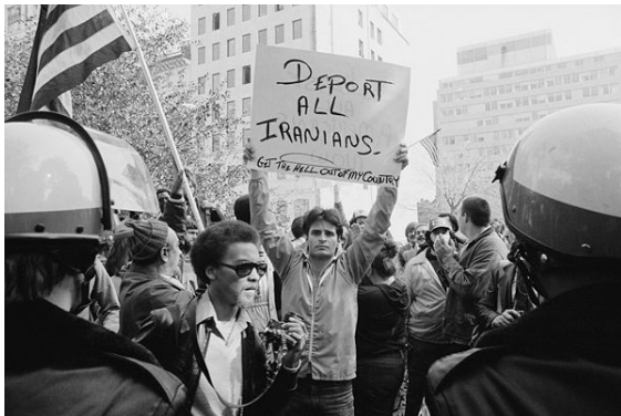
مردی در تظاهراتی در آمریکا علیه ایران در تصویر دیده می‌شود. بر روی تابلو نوشته: «همه ایرانی‌ها را اخراج کنید. گورتان را از کشورم گم کنید»